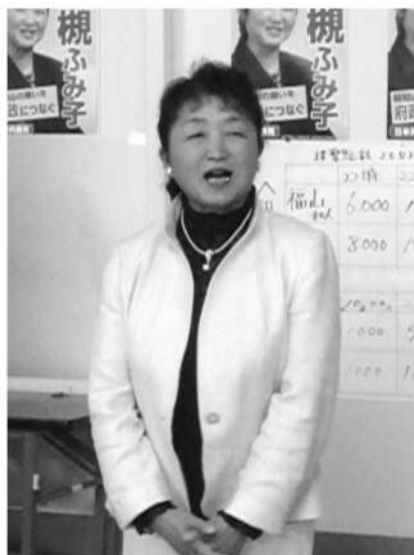
開票結果を受け、 4月8日、選挙事務所で。

こうした結果に確信をもち、来年7月の参院選で野党共闘の勝利と日本共産党の躍進で安倍政権を打ち倒すこと、4月の統一地方選でなんとしても府会議席を得るために直ちに奮闘を始める決意です。