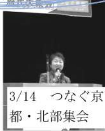
3/14 つなぐ京 都・北部集会