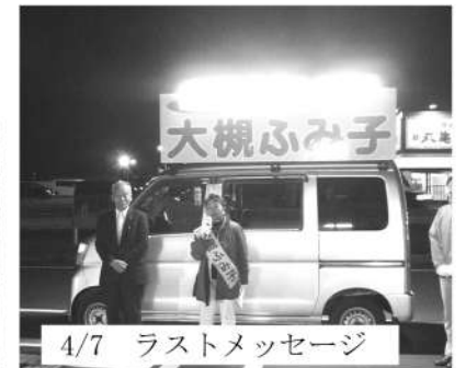
4/7 ラストメッセージ