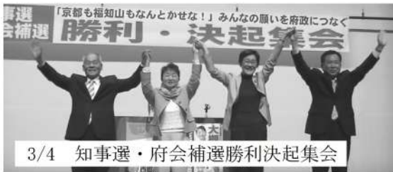
3/4 知事選・府会補選勝利決起集会