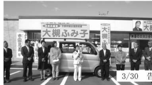
3/30 告示日 出発式